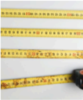
De maat van lokale netwerken